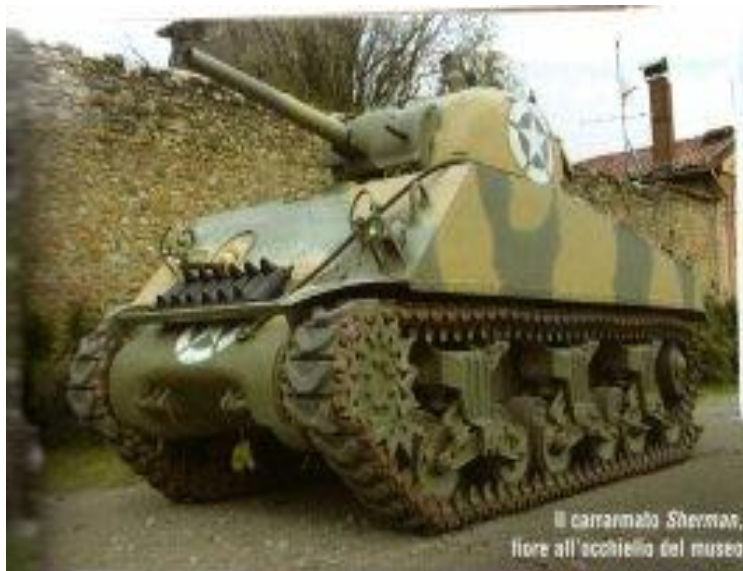
Il carrarmato Sherman, fiore all'occhiello del museo