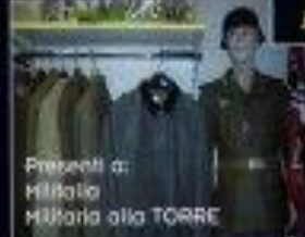
Preparati a: Militaria Militaria alla TORRE